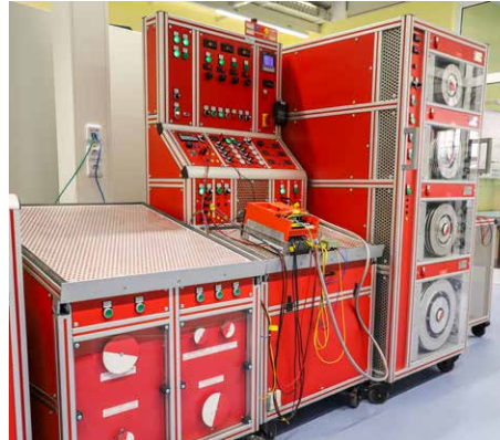
Universal-Prüfstand für Frequenzumrichter

Unsere Services aus einer Hand helfen Ihnen, Zeit und Ressourcen zu bündeln. Die aufwendige Migration auf Nachfolgeprodukte entfällt. Die Zertifizierungen Ihrer Maschinen und Anlagen bleiben erhalten. Damit optimieren wir nicht nur Ihre Instandhaltungskosten, sondern sorgen auch dafür, dass Ihre Maschinen und Anlagen dauerhaft „den richtigen Strom“ bekommen.